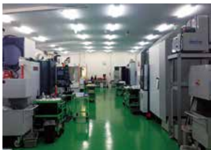
加工技術研究所 (東京都羽村市)