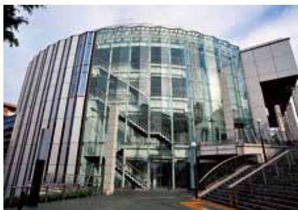
本社はセンター南駅から徒歩 1 分

最適なハードウェア、ソフトウェアサービスを融合した解決方法を提供します。 今までの CAD/CAM システムの運用における現状と問題点を明らかにし、設計から製造までのデータの一气通貫を実現することで手戻りを無くし、生産性を飛躍的に向上させる新しいものづくりをご提案します。