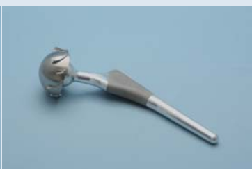
股関節インプラントASSYの 試作品