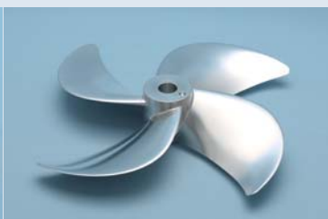
大型石油タンカー用 プロペラ性能試験用試作品