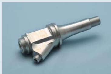
自動車部品の ジョイント部分

自動車、航空宇宙、船舶、医療・・・常に進化が求められる、最先端の分野で、コダマコーポレーションは革新的な技術による、高品質な試作モデルをご提供します。