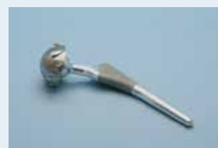
股関節インプラントASSYの 試作品