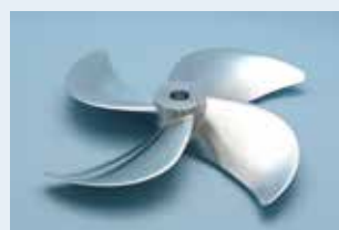
大型石油タンカー用 プロペラ性能試験用試作品