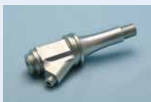
自動車部品の ジョイント部分

TopSolid'Camと5軸マシニングセンターや複合加工機による加工サンプルを多数展示します。