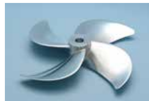
大型石油タンカー用 プロペラ性能試験用試作品