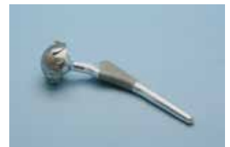
股関節インプラントASSYの 試作品