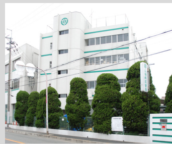
山陽株式会社 本社外観